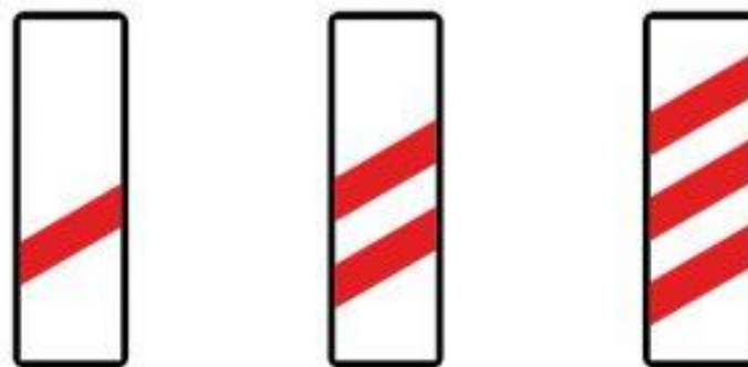
Bahnaken kündigen Eisenbahnübergänge an. Die Baken mit den drei roten schräg gestellten Balken sind ungefähr 240 m, die Baken mit zwei Balken ungefähr 160 m und die Baken mit einem Balken ungefähr 80 m vor dem Bahnübergang angebracht.

Man muss sich bei jedem Bahnübergang davon überzeugen, dass eine gefahrlose Überquerung der Schienen möglich ist. Auch bei gesicherten Eisenbahnkreuzungen mit Lichtsignalanlagen (Licht ist ausgeschaltet) und bei Eisenbahnschranken (Schranken ist oben) muss man links/rechts schauen, horchen und das Tempo so wählen, dass man im Falle eines sich nähernden Zuges anhalten kann. Da der Bremsweg eines Zuges rund neunmal so lang ist wie der eines Autos, können Züge vor einem Hindernis in der Regel nicht rechtzeitig anhalten.